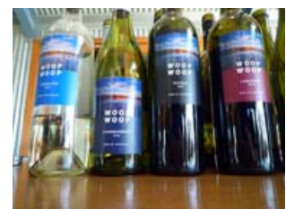
Woop Woop のアイテムです