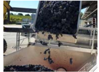
さっき収穫したばかりのブドウ