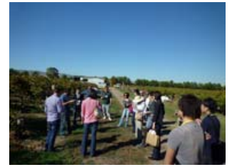
ヴィンヤードでブドウをつまみながら説明を伺いました