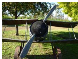
フォックス クリークのシンボルの一つ

テイスティングしたワインは、どれも良い出来だと感じましたが、特に2009年のシャルドネが素晴らしい味わいでした。またリザーブカベルネが非常にエレガントでバランスのよいワインでした。ファシリティーの規模が非常に大きく、最新機器を使ったState of Artの工場・会社の規模を表していました。