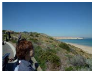
向こうに見えるのは南極?(もちろん見えません)