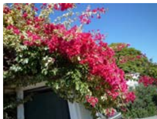
秋口ですがブーゲンビリアが咲き乱れていました