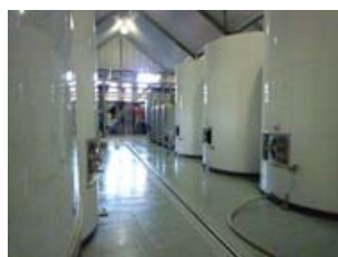
整然かつとても清潔なワイナリー