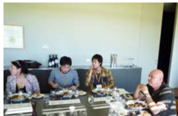
素敵なランチをしながらのセミナー