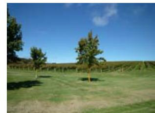
空の青、畑の緑のコントラストが 美しいヴィンヤード